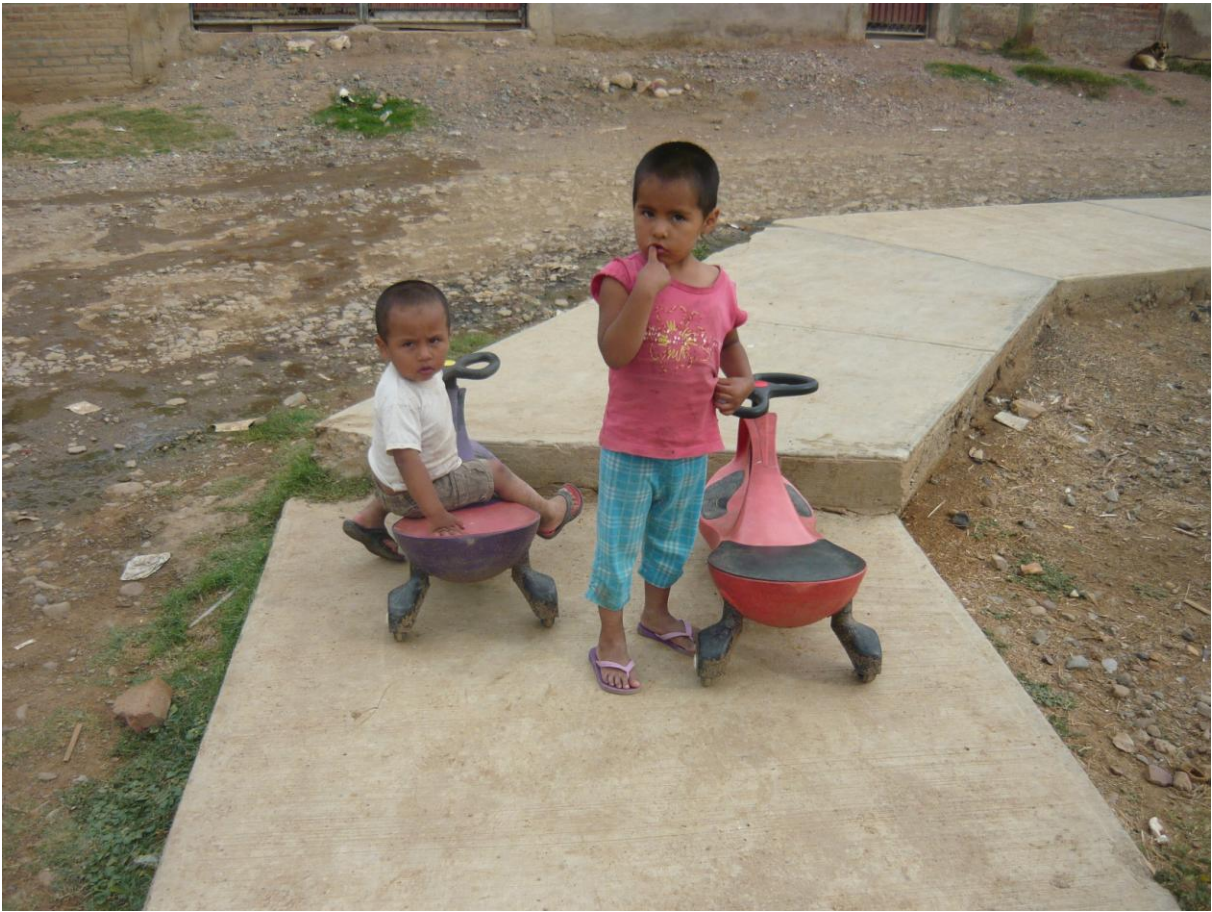
NIÑOS JUGANDO EN LA CALLE CON JUGUETES DONADOS