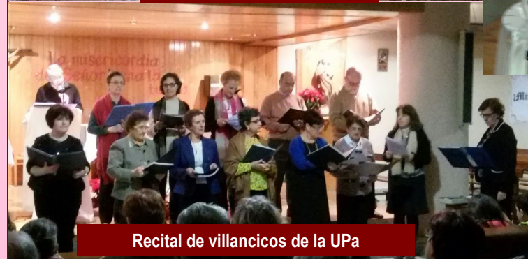
Recital de villancicos de la UPa