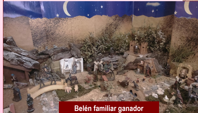
Belén familiar ganador