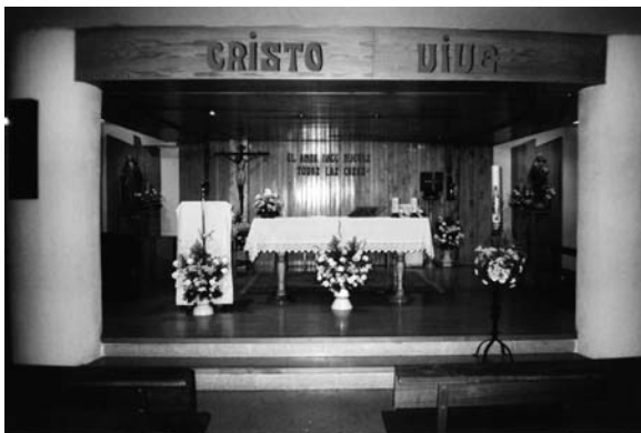
Altar de la parroquia