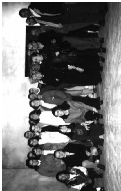
Visita pastoral de 1993, con las obras