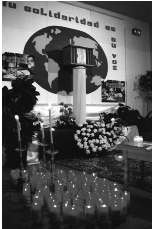
Monumento del Jueves Santo