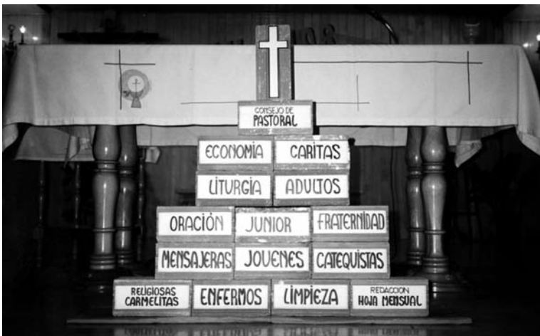
Símbolo representando los grupos en una Visita pastoral

Con mayor o menor perseverancia, lo importante no son los grupos en sí, sino el cauce que suponen de participación en la parroquia y su función evangelizadora, celebrativa o formativa, dentro de la gran comunión de la parroquia.